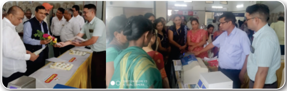
Visit of Chairman NDDB (left) and Women Secretaries (Right) at REIL stall during Gujrat Chapter of IDA at Vasudhara Dairy Valsad on 11.06.2022