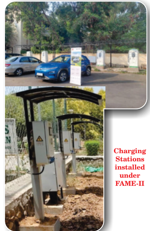
Charging Stations installed under FAME-II

Under ongoing FAME-II scheme, the Company has received LoA from Ministry of Heavy Industries (MHI), Govt. of India for 25 nos. of EV Charging stations to be deployed in Udaipur and Delhi.