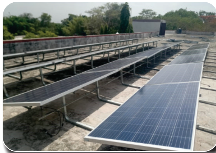
SPV Power Plant installed at ITIs under RCVET Project

The Solar power solutions have been fulfilling the electricity needs of almost all areas and sectors now. The Company has received and executed order for Rajasthan State Bharat Scouts & Guide department, Jaipur for 24 kWp Grid Connected SPV Power Plant during the quarter.