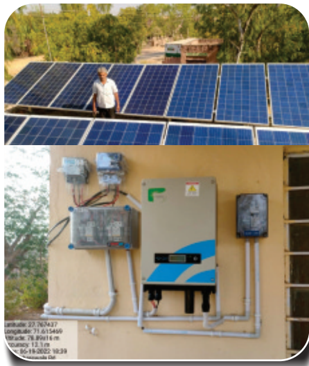
SPV Power Plant installed in Forest Nurseries

For Forest Department, REIL has successfully executed order of 12 Nos. of 1 kWp Off Grid SPV Power Pack Systems to be deployed at Forest Chowkis.