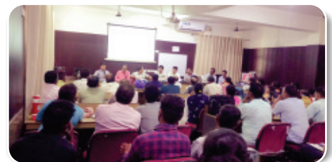
Training on Advance DPMCU by REIL officials.

REIL also organized the training on Advance DPMCU accounting package in various milk unions under UCDF Haldwani.