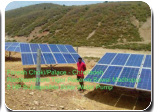
5HP SPV Water Pumping Systems, 1kWp SPV Power Plants for Lighting purposes at Forest Chowkies at Ranthambore Tiger Reserve

Hon'ble Secretary, Ministry of Heavy Industries, GoI Shri Arun Goel, have witnessed the products / solutions installed at Ranthambore tiger reserve and Sawai Madhopur Centre of Excellence, during the quarter.